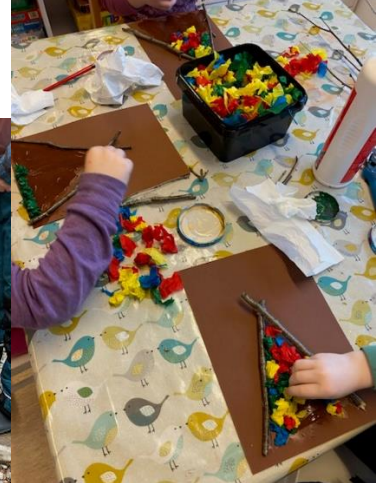
TEMA OM SAMENE