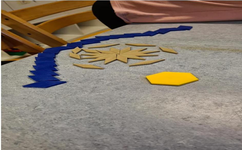
Sol, hav og blomster